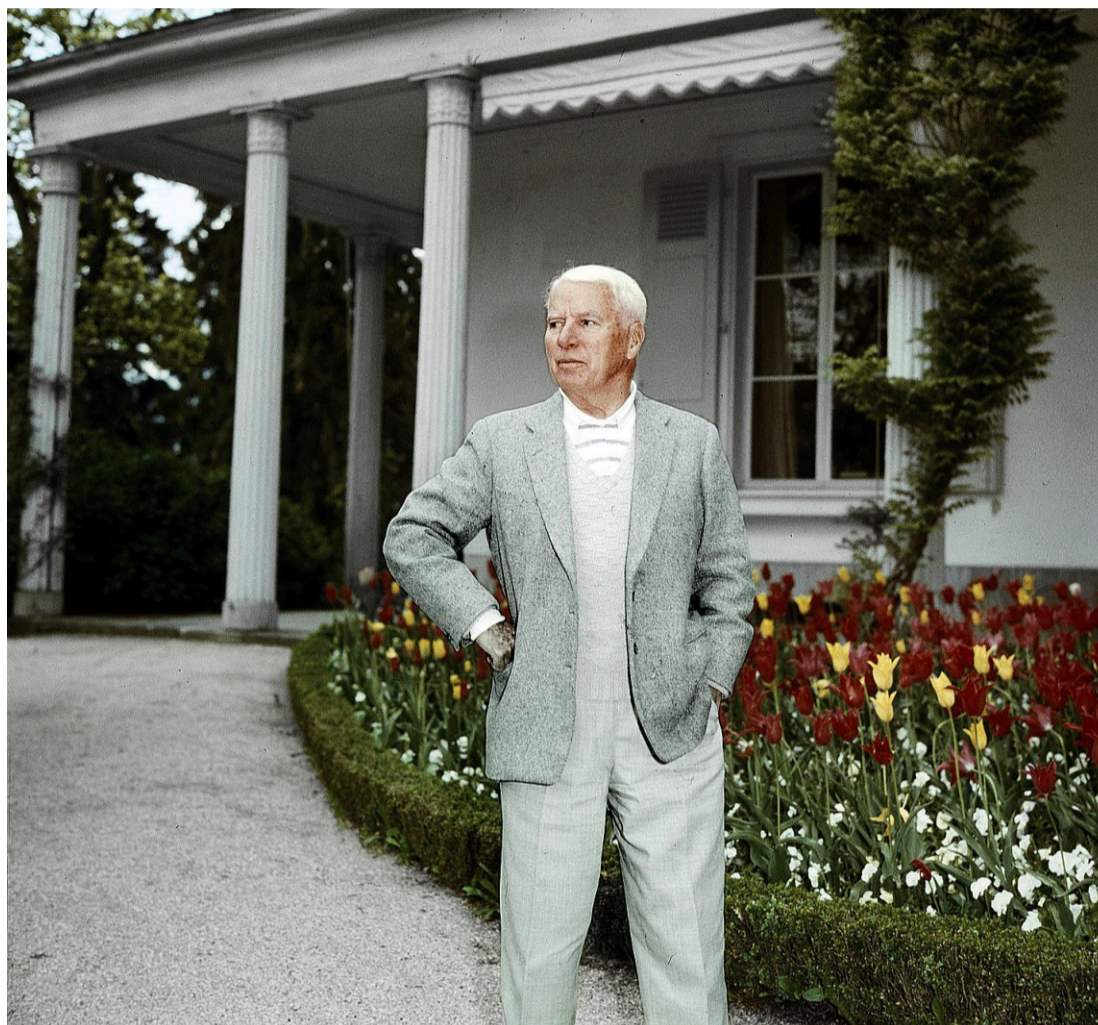
Charlie Chaplin, une des plus grosses fortunes du monde à l'époque, a bénéficié d'un forfait fiscal dans le canton de Vaud. En Suisse, 3478 personnes bénéficient du forfait fiscal, selon les derniers chiffres de 2022.

Bref rappel du mécanisme: le forfait fiscal, ou impôt d'après la dépense, est destiné aux ressortissants étrangers fortunés domiciliés en Suisse, mais qui n'y exercent aucune activité lucrative. L'État n'impose pas leur revenu ou leur fortune, mais évalue leur train de vie, à l'époque généralement calculé sur le quintuple des frais de loyer annuels. L'acteur Charlie Chaplin,