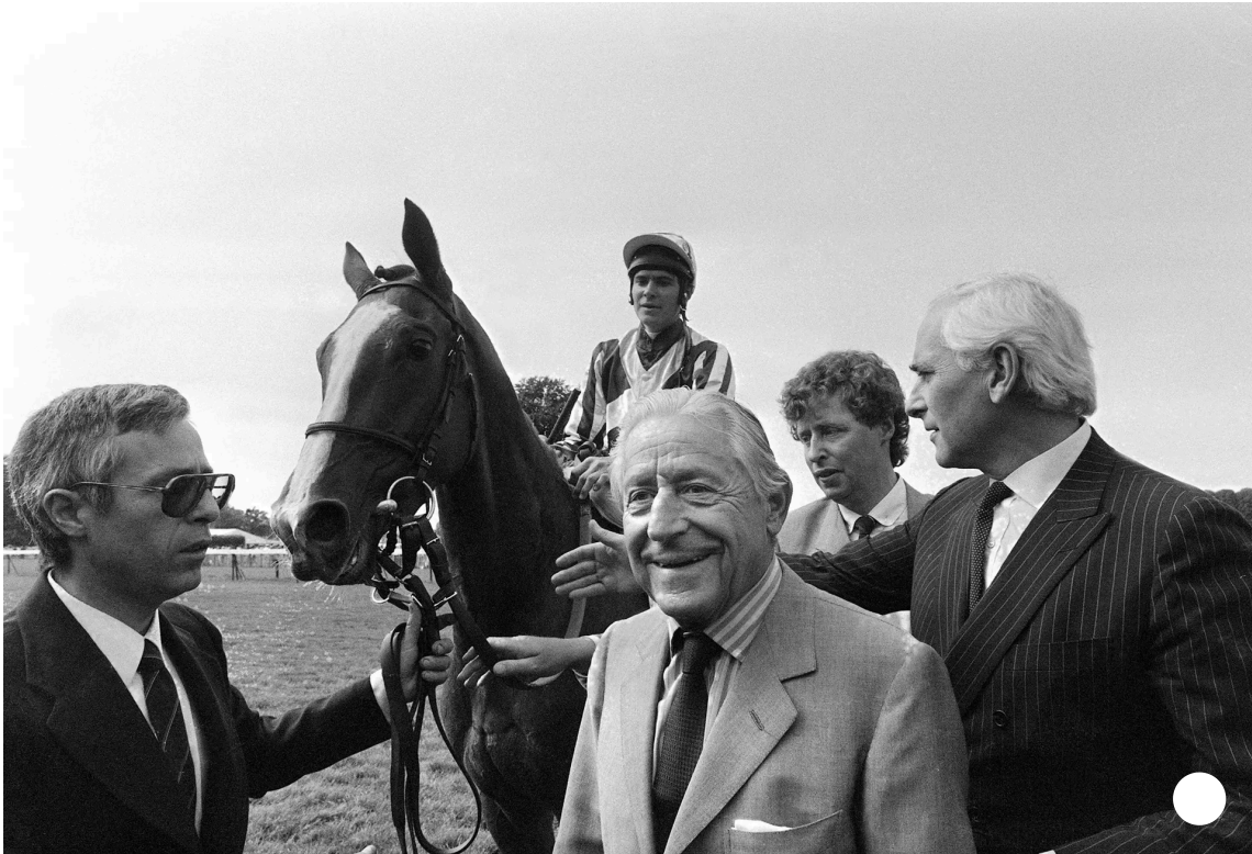
Auch der griechische Reeder Stavros Niarchos, hier bei einem Pferderennen in Frankreich, profitierte von einem Pauschalsteuerabkommen.

ritz jährlich 16'000 Franken. Beide zählten zu ihren Lebzeiten zu den Superreichen dieser Welt .